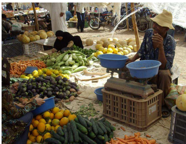
Marché de producteurs dans le sud marocain

Toutes les filières sont concernées : il s'agit pour le gouvernement marocain de donner aux acteurs agricoles le maximum de chances de réussir cette mutation.