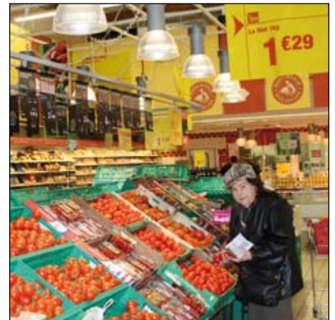
La grande distribution devra appliquer une baisse automatique de ses marges en période de crise, sur la base de l'accord du 17 mai.

Enfin, à l'heure où nous écrivons ces lignes, Légumes de France regrette vivement l'absence de réponse aux problématiques de compétitivité, notamment en ce qui concerne le coût du travail et les distorsions de concurrence intra européennes, dans ce projet de loi. ▲